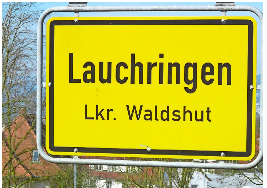
Lauchringen ist ein Magnet für Besucher aus Deutschland und der Schweiz.

Durch den Ausbau des Gewerbegebiets «Wiggenberg» und die Ansiedlung neuer Einzelhandelsfirmen im Gewerbegebiet «Im Ried» sowie die gute Verkehrsanbindung ist Lauchringen zum idealen Wirtschaftsstandort geworden. Einige Standortnachteile, wie das hohe Lohnniveau, werden kompensiert. Eine solide, logistische Infrastruktur, die gute Zusammenarbeit mit den Behörden sowie die Nähe zu den Kunden und Lieferanten sind entscheidende Gründe, die für den Standort Lauchringen sprechen. Darüber hinaus