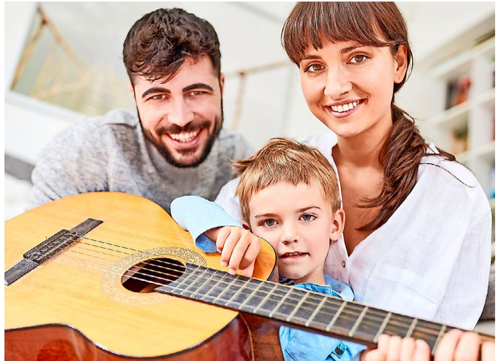
Mit Musik glücklich und gesund durch die kalte Jahreszeit.

Warum nicht wieder einmal die Blockflöte hervorheben, die Gitarre stimmen und ein paar einfache Melodien versuchen? Ein paar Fingerübungen auf dem Klavier probieren? Und auch für alle jene, die schon lange den Wunsch verspüren, ein Instrument neu zu erlernen, ist der Zeitpunkt ideal: Die Musiklehrerinnen und -lehrer der Musikschule Zürcher Unterland unterstützen Sie dabei gerne.